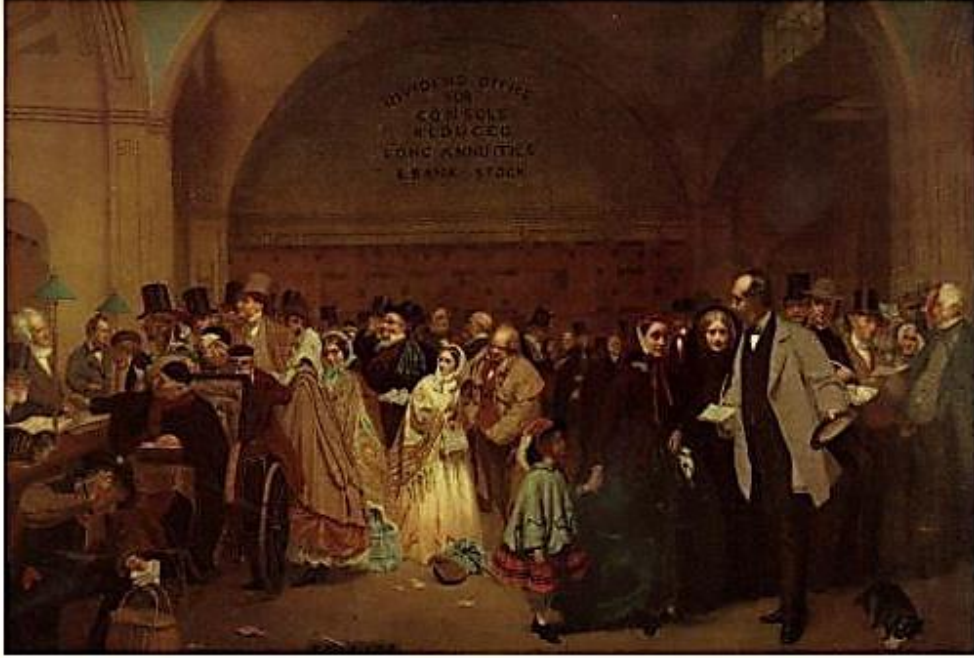
"DIVIDEND DAY AT THE BANK OF ENGLAND", 1850